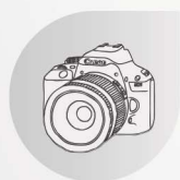
EOS數碼單鏡反光 相機