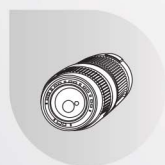
EF, EF-S, EF-M, RF 鏡頭