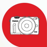
EOS M, EOS R 數碼可換鏡頭相機